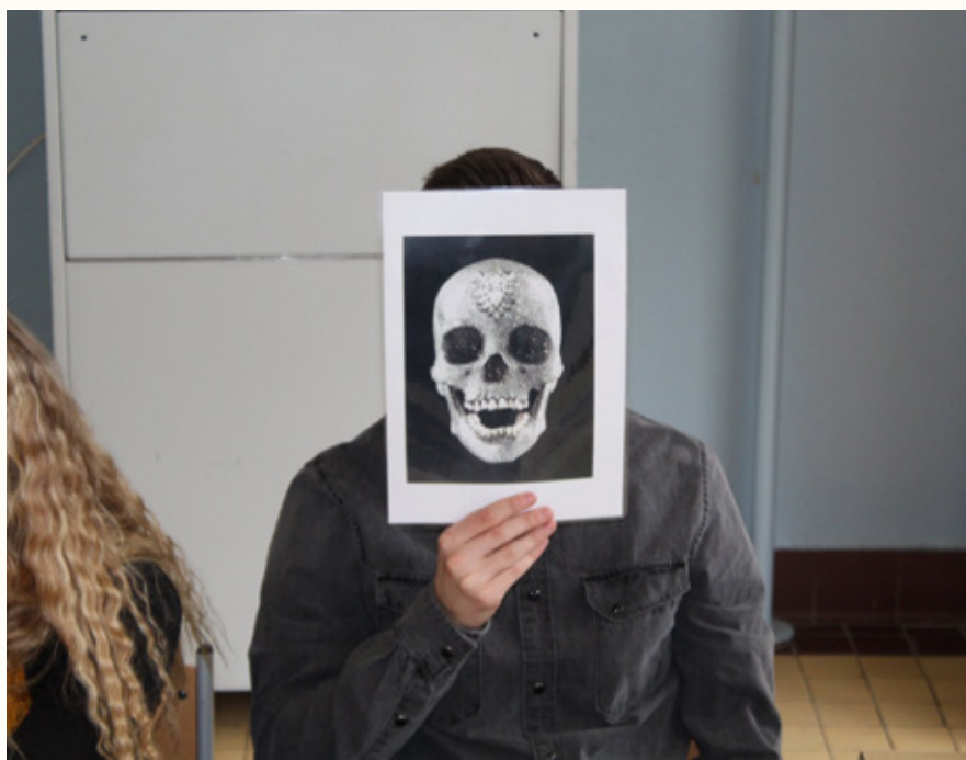
L'artiste / Damien Hirst