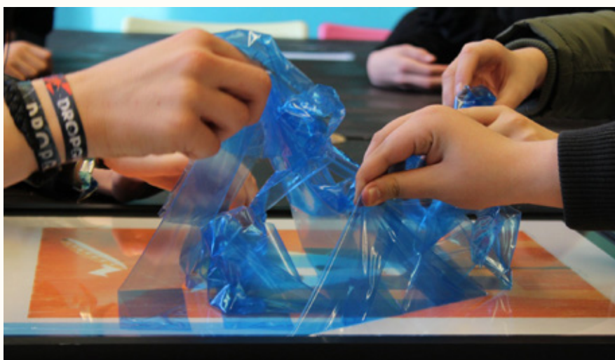
L'artiste / Laurence Gonry

Aujourd'hui, grâce au travail de l'équipe du Secteur des Arts plastiques, ces œuvres ont quitté, pour un temps, les réserves du Musée afin de s'exposer aux murs des classes d'écoles.